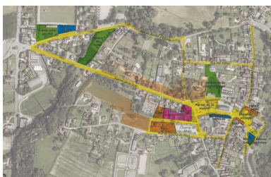
Redynamisation du centre village de Corbelin (38)