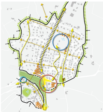
Orientations d'aménagement et de développement durables pour le PLU de Toulaud (07)